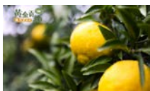
黄金贡柚 品牌宣传短片 抖音中的农特产品宣传视频