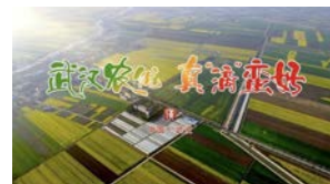
CCTV-13台播出 武汉市农产品广告宣传片

以上几点是我个人对如何创作好一个农业类视频的简单见解和经验之谈希望可以帮助到大家。