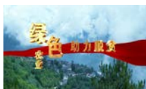
绿色农业助力脱贫 云南怒江特色农产品宣传